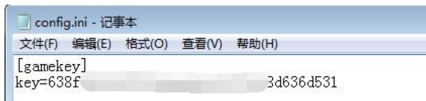
图 1 gamekey 配置

用户需要将 gamekey 填写在该配置文件中, 格式如图 1 所示。若无 gamekey, 请至官网申请。