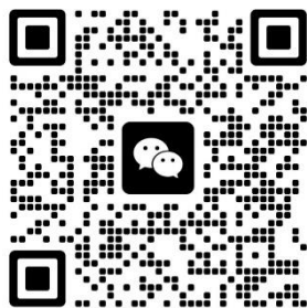
扫码添加咨询微信