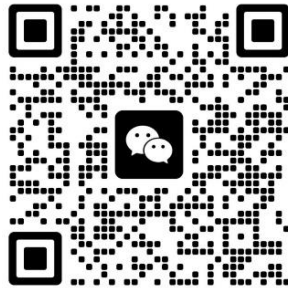
扫码添加咨询微信