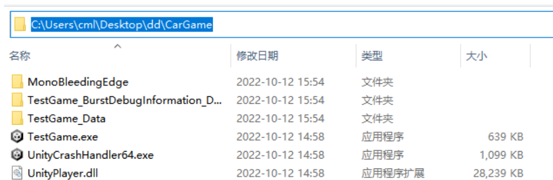
图 1 加固游戏路径展示

如下图 1 所示：需要加固的路径为:C:\Users\cm\\Desktop\dd\CarGame